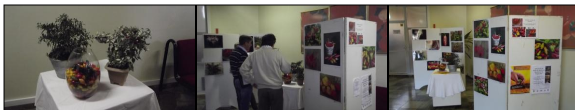
Figura 4. Exposição “Variedades Crioulas de Pimentas” durante o I Encontro REGENSUL - 4 e 5 de julho de 2013-Florianópolis/SC.