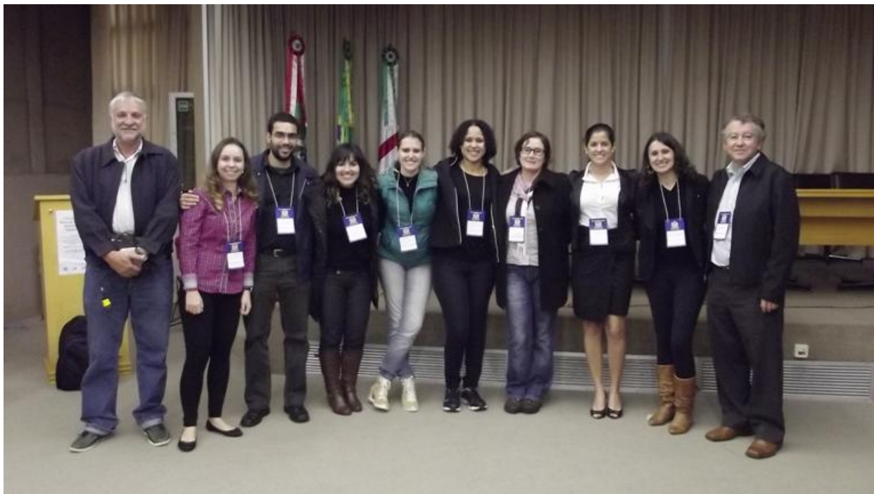
Figura 5. Comissão organizadora do I REGENSUL - 4 e 5 de julho de 2013-Florianópolis/SC.