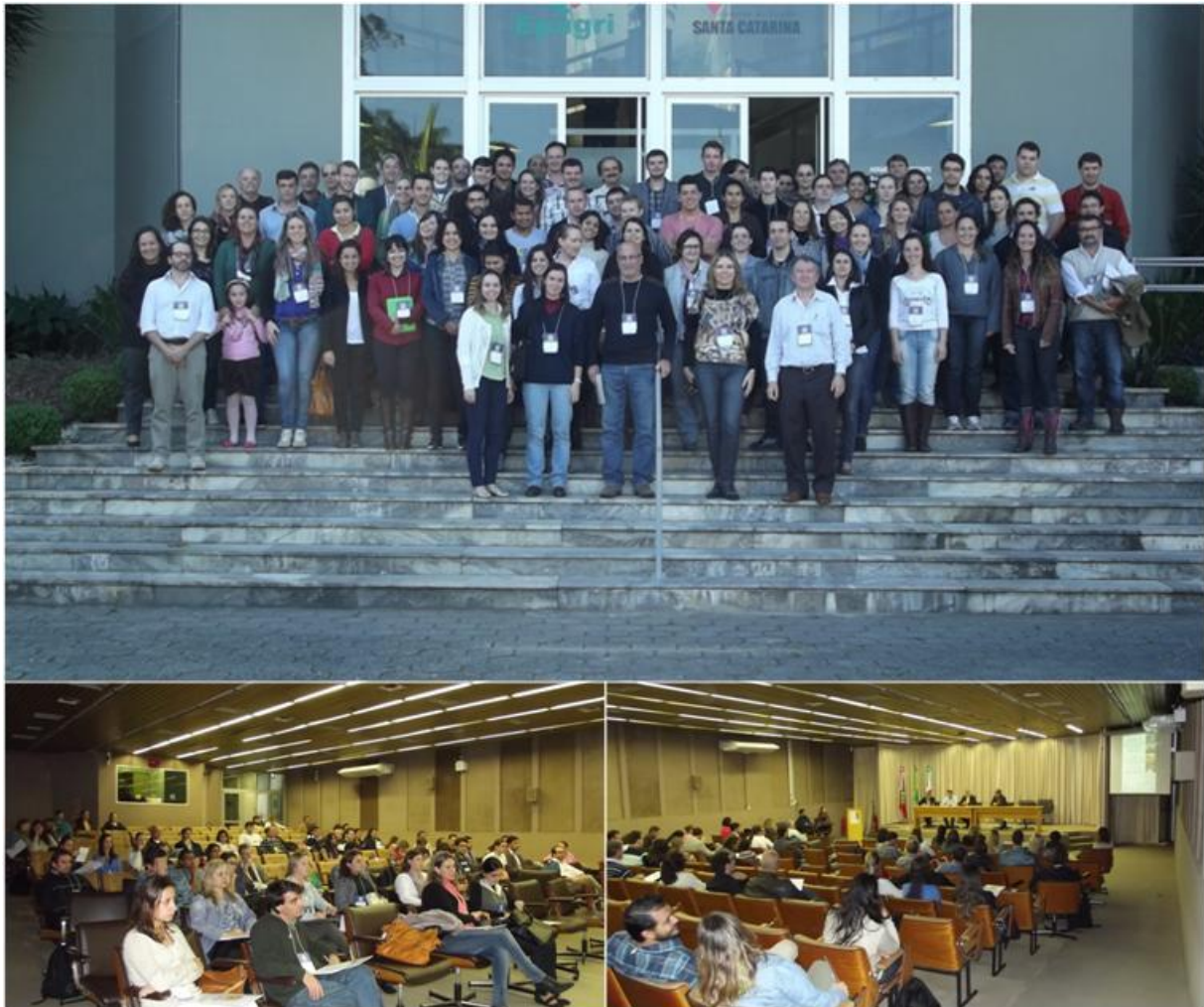
Figura 1. I Encontro REGENSUL

Foram realizadas apresentações de programas de pesquisa, pós-graduação, instituições públicas e outros grupos sobre as atividades que envolvem os recursos genéticos, com intervenções curtas sobre coleta, caracterização, conservação, uso e manejo de recursos genéticos. O evento contou com a participação de professores, estudantes de pós-graduação, pesquisadores e Instituições de ensino e de pesquisa da Região Sul que desenvolvem trabalhos nas áreas de Recursos Genéticos.